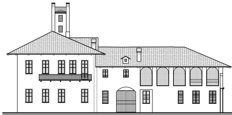
Prospetto sud ovest - scala 1:100