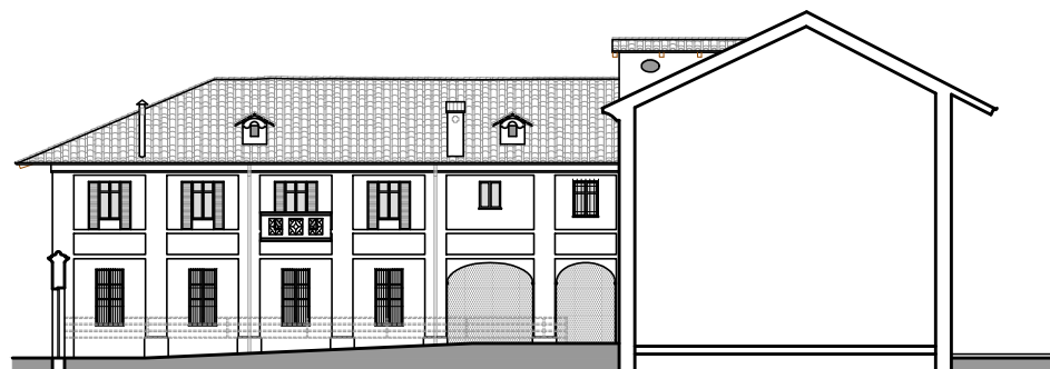
Prospetto su cortile - scala 1:100